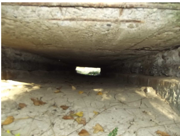
Pohľad do priepustu

Samotný priepust je značne zanesený bahnitým kalom na cca 80%. Vtokové a výtokové čelo doskového priepustu je poškodené - rozrušené. Priekopa na vtoku a výtoku značne zanesená. Správca cesty v rámci údržby zabezpečí prečistenie odvodňovacej priekopy tak, aby bol zabezpečený voľný odtok.