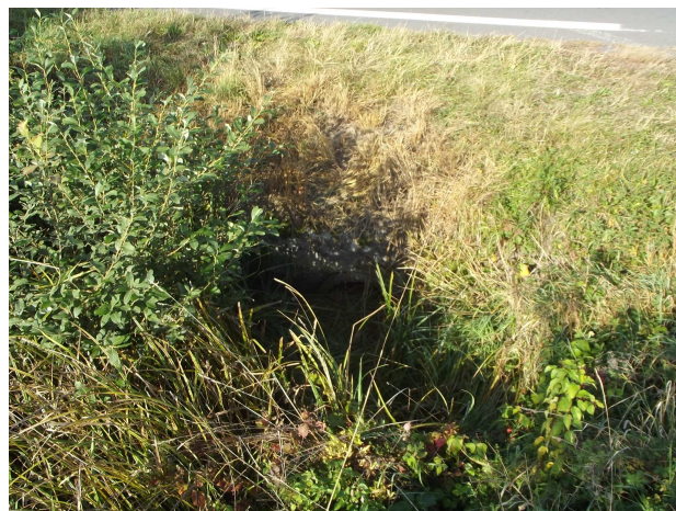
Pohľad na výtok