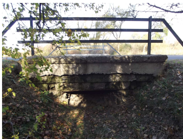
Pohľad na výtok