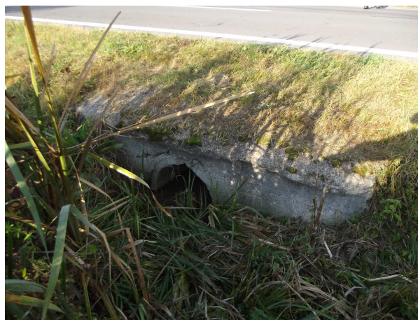
Pohľad na výtok

Samotný priepust je zanesený bahnitým kalom, vtokové čelo s rímsou je rozrušené, na výtoku mierne poškodené.