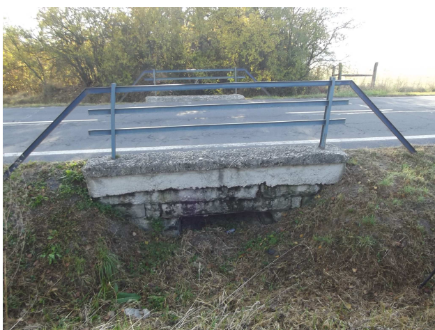
Pohľad na vtok