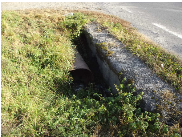
Pohľad na vtok