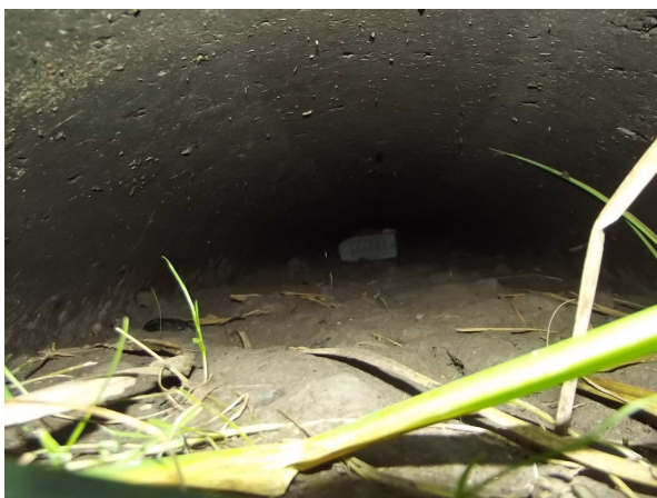
Pohľad do priepustu

Samotný priepust je značne zanesený bahnitým kalom cca 80%. Vtokové a výtokové čelo rúrového priepustu je poškodené.