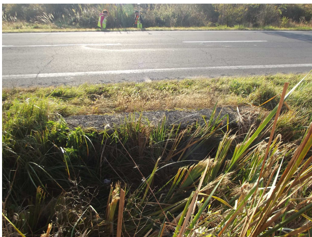
Pohľad na vtok